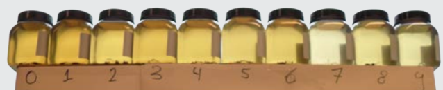
Visueller Wasserqualitätstest RAS-Futter der 2. Generation – wöchentliche Muster